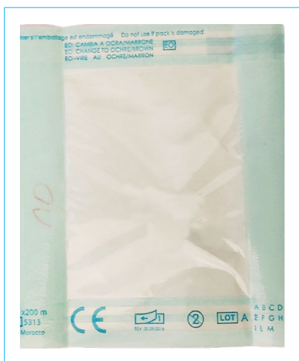
Bustina da sterilizzazione

3. Il prodotto da sostituire deve essere opportunamente deterso e inserito in una bustina da sterilizzazione. La bustina con il prodotto dovrà essere inserita, insieme al DDT compilato come da istruzioni, in una busta/scatola predisposta per il ritiro da parte del corriere.