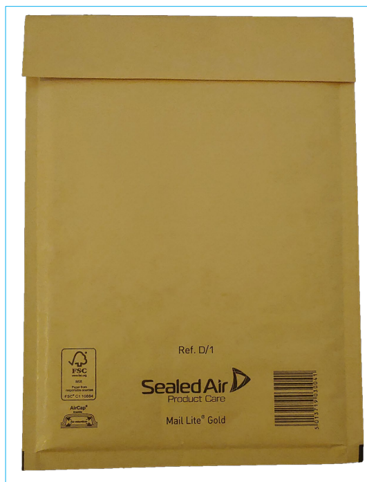
Busta per spedizione